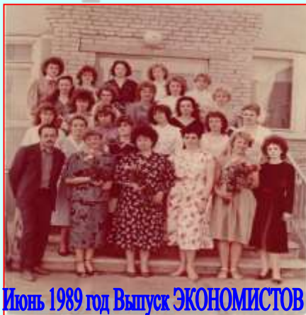
Июнь 1989 год Выпуск ЭКОНОМИСТОВ