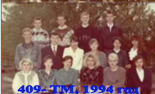
409- ТМ, 1994 год