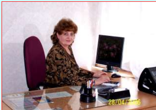
Зав. заочным отделением