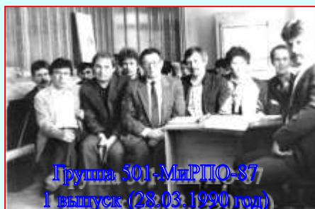
Группа 501-МлППО-87 I выпуск (28.03.1990 год)