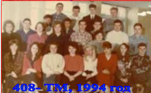
408- ТМ, 1994 год